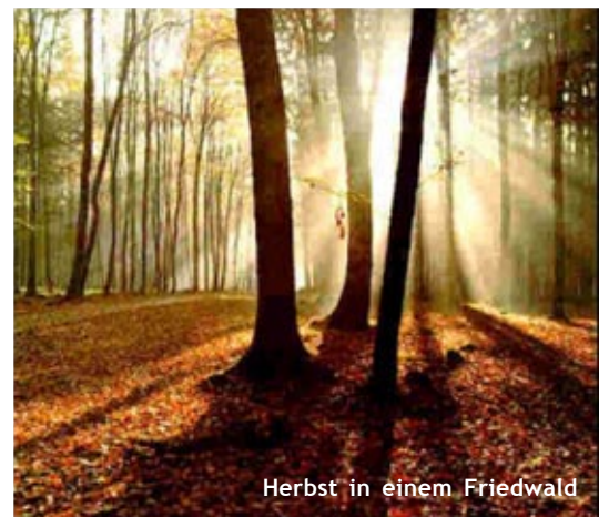
Herbst in einem Friedwald