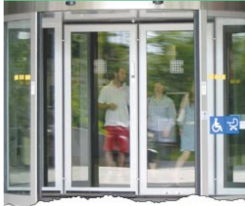
Ausgabe Juli 2005